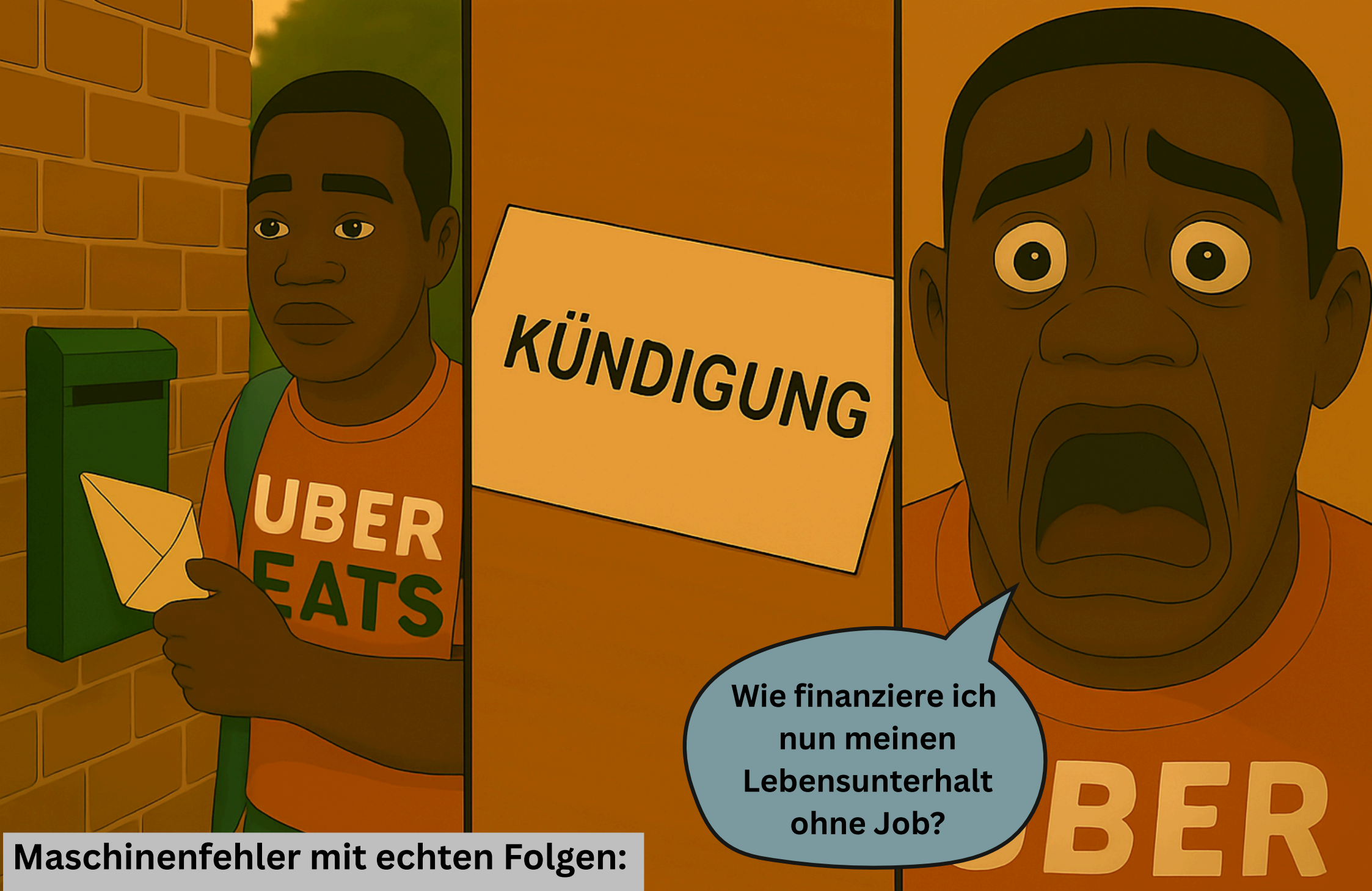
Maschinenfehler mit echten Folgen: Ein Algorithmus macht ihn arbeitslos.