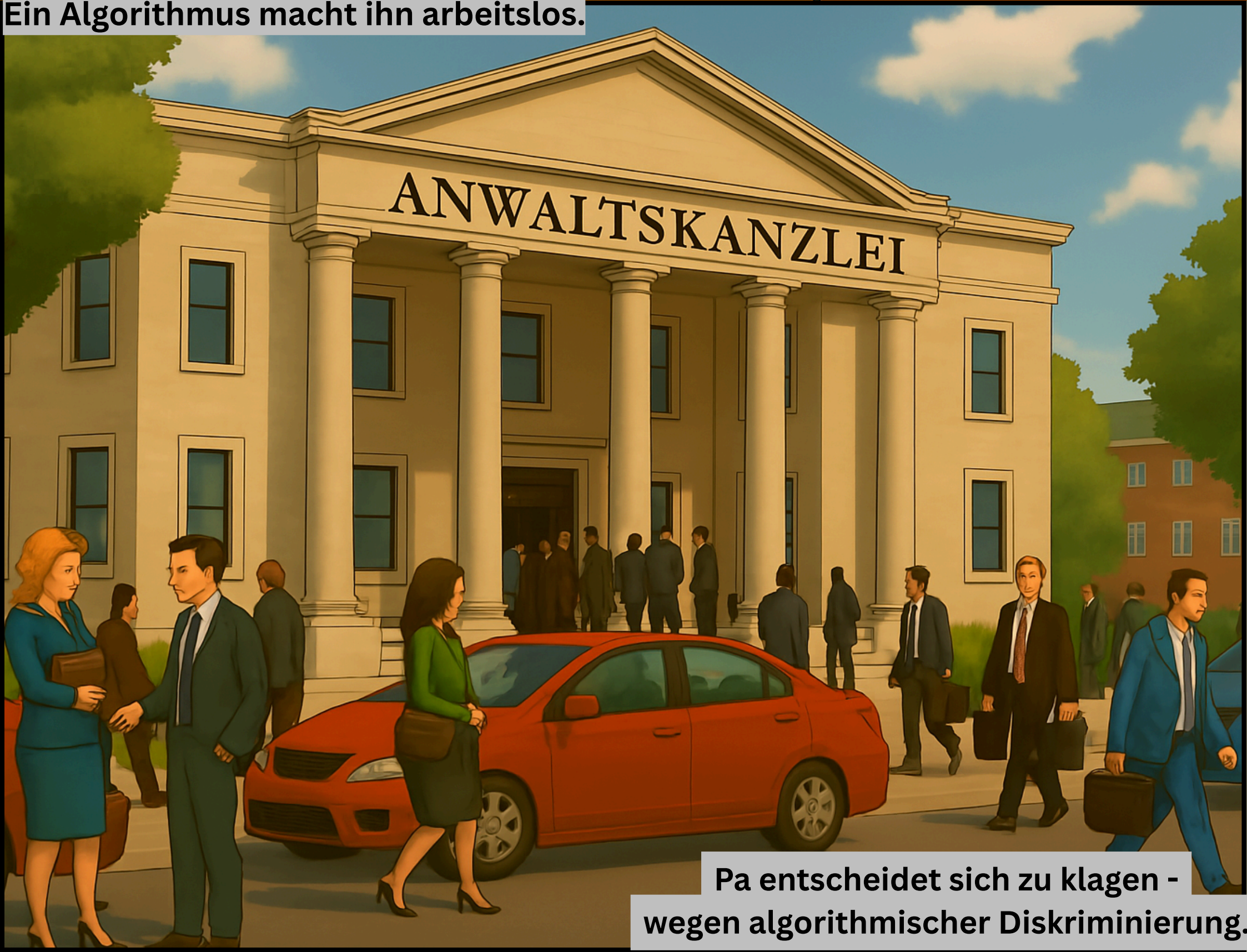
Pa entscheidet sich zu klagen - wegen algorithmischer Diskriminierung.