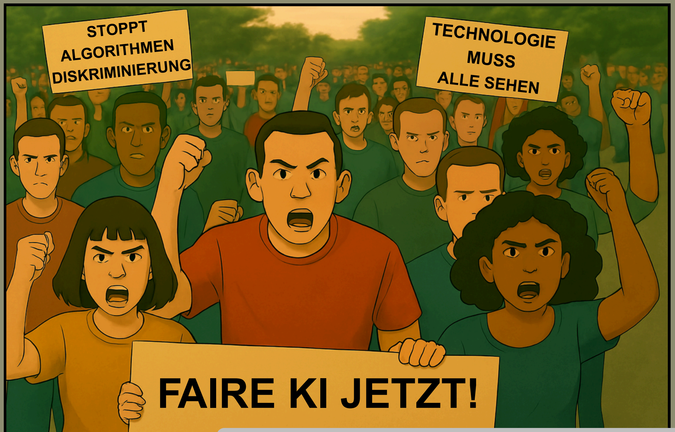
Die Menschen protestieren und fordern Gerechtigkeit